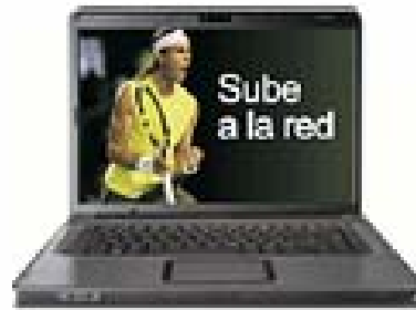
HP Compaq + Disco Duro

Regalo por domiciliación e ingresos y recibos ¡ Tú Eliges!