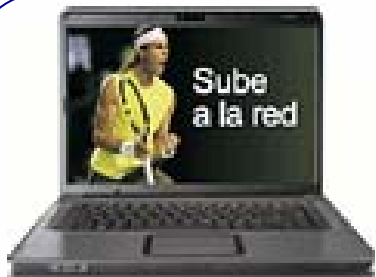
HP Compaq + Disco Duro

Regalo por domiciliación de ingresos y recibos