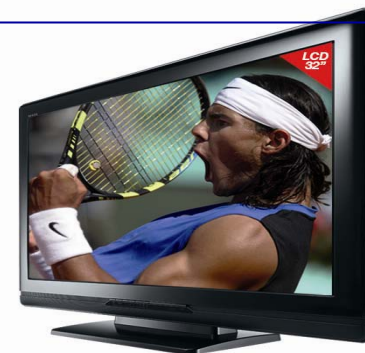
TV LCD TOSHIBA 32"