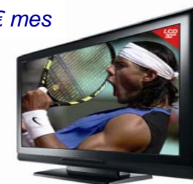
TV LCD TOSHIBA 32"

Regalo por domiciliación de ingresos y recibos No elijas, ¡Llévate los dos!