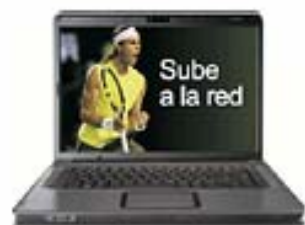
HP Compaq + Disco Duro

Regalo por domiciliación de ingresos y recibos No elijas, ¡Llévate los dos!