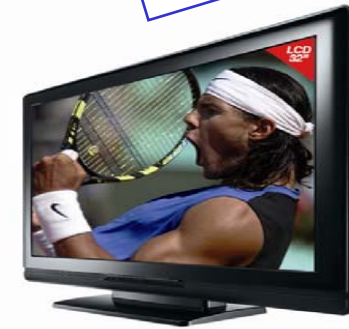
TV LCD TOSHIBA 32"

Regalo por domiciliación e ingresos y recibos ¡ Tú Eliges!